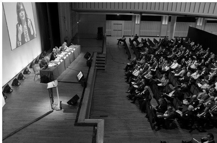
Assemblée Générale 2010 de la FEHAP à la Maison de la Mutualité

L'article 6 du règlement intérieur de la FEHAP prévoit que « Les administrateurs étant renouvelables par tiers tous les deux ans, le Conseil d'Administration arrête la liste des postes renouvelables ou à pourvoir. Les candidatures sont adressées au moins deux mois avant l'ouverture de l'Assemblée Générale , par écrit au Président de la Fédération et le Conseil d'Administration dresse la liste des candidats... ».